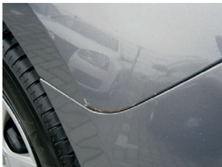
Roest is bij de kwaliteit van de auto's van tegenwoordig altijd een signaal van een nog niet herstelde lakbeschadiging. Meld lakschade en roestschade dan ook tijdig aan Broekhuis Lease om nog grotere schade te voorkomen.