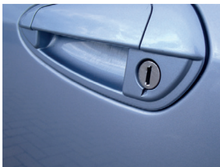
Schade door inbraak .

Natuurlijk zijn er veel meer soorten van schade dan in dit boekje vermeld. Toch willen we proberen ook de laatste punten waar we op letten bij inlevering van uw leaseauto hier nog noemen. Niet in de veronderstelling elke discussie achteraf te voorkomen, maar wel in 99,9% van alle gevallen.